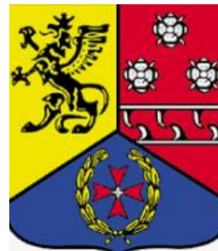
Herb Gminy Wejherowo