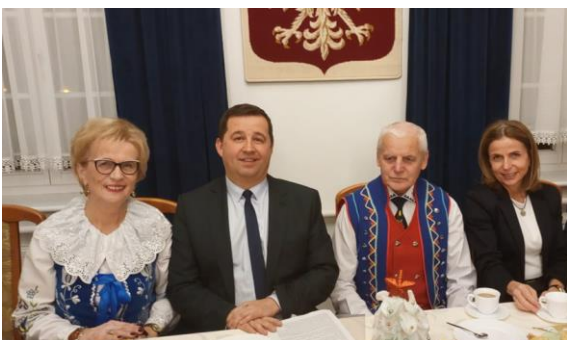
Przy wigilijnych stolach.