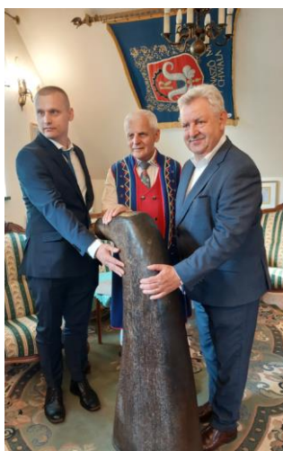
Senator K. Kleina w biurze ZKP O/Rumia przy największej tabakierze świata.

inicjatorem był senator Rzeczypospolitej Polskiej, przewodniczący Kaszubskiego Zespołu Parlamentarnego Kazimierz Kleina. Wystawa zadebiutowała w salach Senatu RP w Warszawie w marcu ubiegłego roku, a w jej stworzeniu wzięły udział: