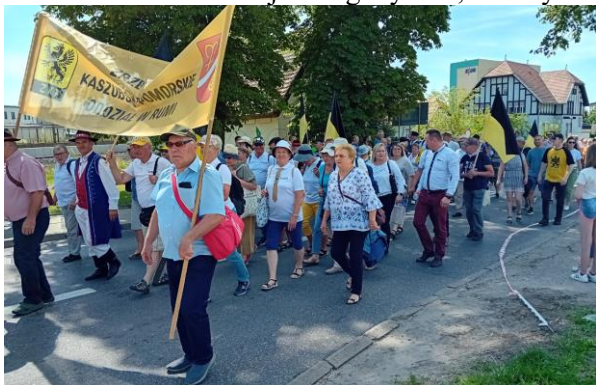
Przemarsz ulicami Kartuz.

Gdy tylko pochód się uformował, Kartuzy utonęły w morzu czarno-żółtych flag, strojów, wianków na głowach, kapeluszach z pamiątkowymi przypinkami z poprzednich zjazdów, papierowych chorągiewkach, czarno-żółtych szalikach i chustkach, a przede wszystkim radosnych twarzach. Kolorowa parada dotarła wkrótce do kartuskiej kolegiaty. Ci, którzy nie