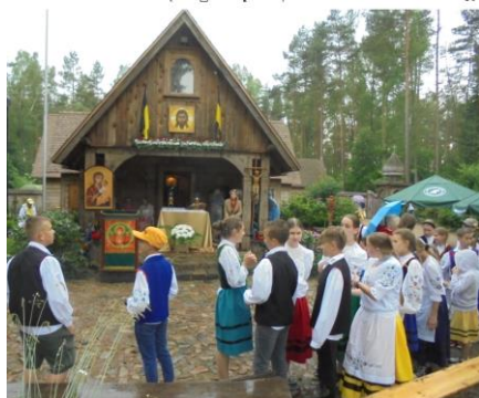
Kaplica na Świętej Górze Polanowskiej

17 czerwca 45 członków i sympatyków Zrzeszenia z Rumi wraz z poczem sztandarowym wybrało się na pielgrzymkę autokarową na IX Odpust Kaszubski ku czci Matki Bożej Pani Pomorza w Polanowie. Polanów to miasto we wschodniej części woj. zachodniopomorskiego, w powiecie koszalińskim, nad rzeką Grabową, będące siedzibą gminy miejsko-wiejskiej. W odległości ok. 3 km na zachód od Polanowa znajduje się Święta Góra (156 m n.p.m.), będąca miejscem kultu dla pogańskiej ludności, zamieszkującej te rejony we wczesnym średniowieczu. Po chrystjanizacji Pomorza do Polanowa przybyli cystersi, którzy w XIV wieku zbudowali na Świętej Górze kaplicę z obrazem