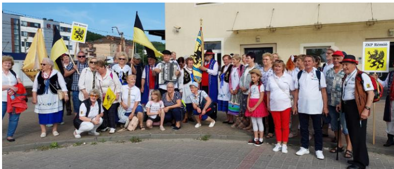
Na dworcu w Rumi w oczekiwaniu na „Transcassubię”.

Oczywiście, na zjeździe nie mogło zabraknąć członków rumskiego partu. Wyjechali o godz. 8.39 z dworca w Rumi, zabierając się Transcassubią. Przy wesolej muzyce, piosenkach, żartach droga