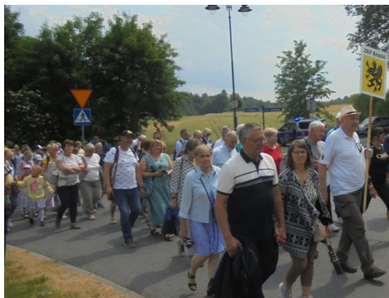
Rumianie w drodze na Św. Górę Polanowską

tegorocznych uroczystościach odpustowych wzięli udział liczni Kaszubi z wielu miast i wiosek na Kaszubach, przeważnie reprezentujący swoje party zrzeszeniowe. Spod figury św. Ottona (centrum