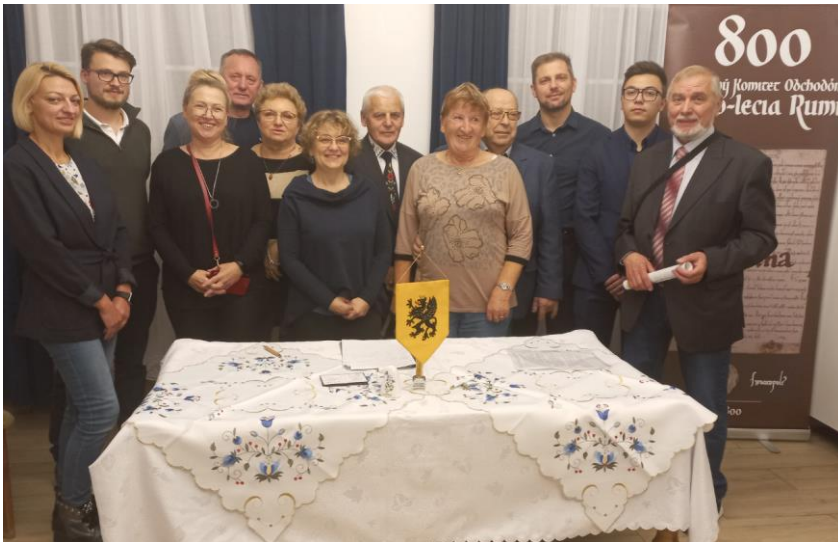
Kadencja 2022-2025 - nowy zarząd ZKP O/Rumia